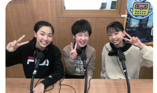
3月18日 八千代台東小学校 学校自慢、総合体育祭、他校にない特殊な行事について