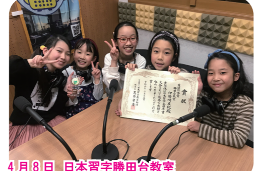
4月8日 日本習字勝田台教室 日本習字全国大会のことや、楽しい教室や先生のこと等について