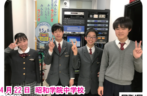
4月22日 昭和学院中学校 放送部の活動や、昭和学院あるある、英語に力を入れた行事等について