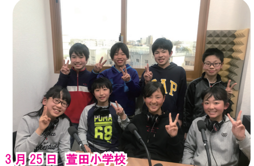
3月25日 萱田小学校 ポリビイド場のこと、萱田小の特徴や思い出、中学校で楽しみにしていること等