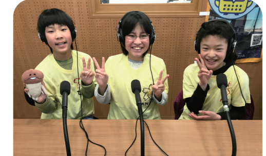
3月4日 こどものまち ミニさくらのブースの説明や子どもスタッフの仕事、佐倉市のことについて