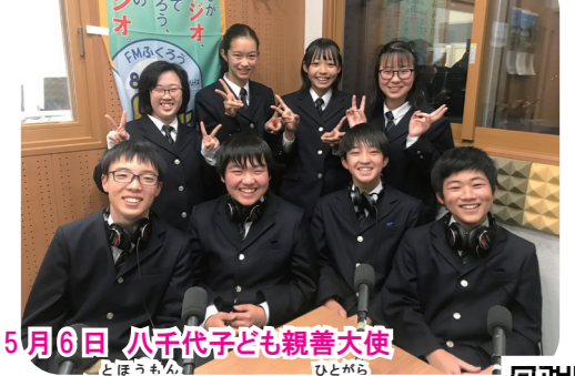
5月6日 八千代子ども親善大使 バンコク都訪問にて、国や人柄について感じたことやホームステイ等について