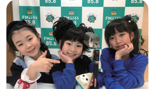
3月11日 モデルユニット under7 モデル活動をはじめたきっかけ、レッスンや出演したショー等について