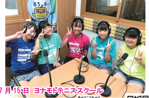
7月15日 ヨナモトネズスクール スクールの練習のことや、休校中のこと、今後の目標について

こどもんぶん 2020年6月発行は新型コロナウイルス感染症拡大の観点から休刊いたしました。ご出演団体は3月以降放送分をご紹介します。