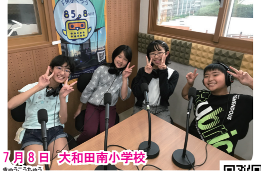
7月8日 大和田南小学校 休校中のことや、新しい学校生活のことについて