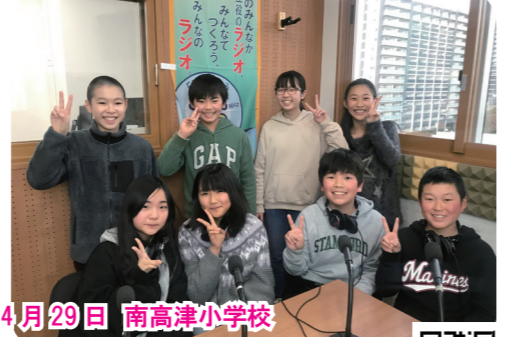
4月29日 南高津小学校 「なかよしタイム」「ありがとう集会」「誕生会」「南高音楽祭」について