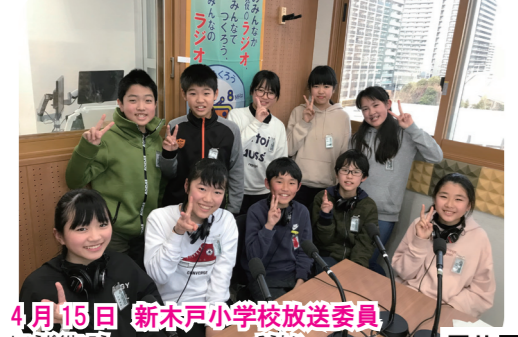
4月15日 新木戸小学校放送委員 修学旅行、自然の家、総体、卒業への思いについて